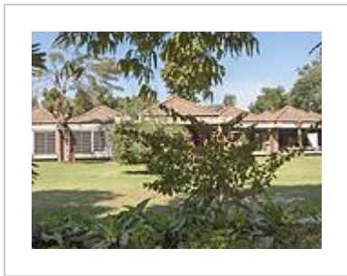
Gandhi Sangrahalay - Outside