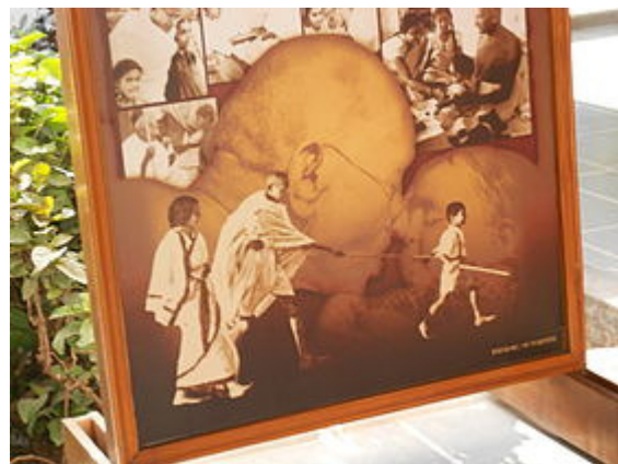
ସାବରମତୀ ଆଶ୍ରମ, ଅହମଦାବାଦ