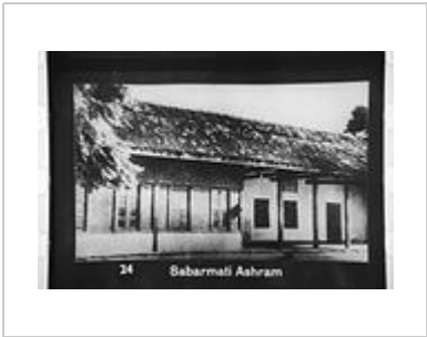
Sabarmati Ashram in 1948