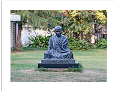
Bust of Mahatma Gandhi at the ashram