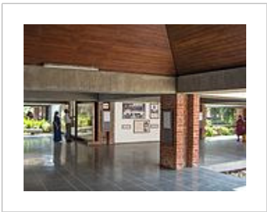
Gandhi Sangrahalay - Inside Corridors