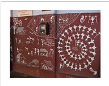
Warli Art at Sabarmati Ashram