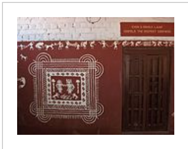
Warli Art at Sabarmati Ashram