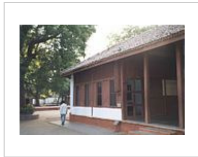
Front view of Mahatma Gandhi's House