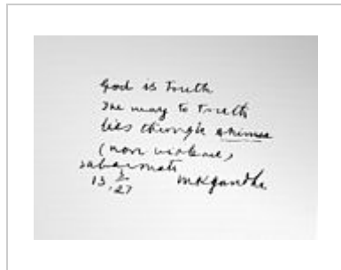
God is Truth, Circa 1927