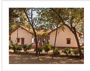
Back view of Mahatma Gandhi's house