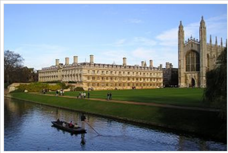
كنيسة كلية الملك (en) المشهد المؤلف للجامعة لدى عامة الناس