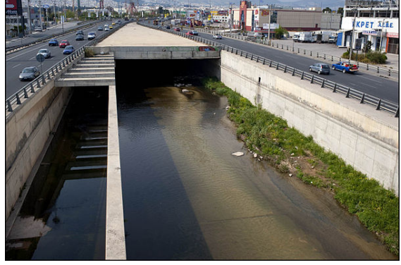
منظر مطل على نهر كيفيسوس من أعلى - من فوق جسر على طريق أثينا-لمياء السريع.

ويرجع اسم النهر إلى شخصية ذكرت في كتاب أثرى "بيليويتيكا" أو "المكتبة" عن الأساطير و البطولات اليونانية، حيث تظهر الفقرة (3.15.1) أن زوجة الملك إيريشثيوس القديم ، براكسيثيا ، كانت ابنة فراسيموس (غير معروف بخلاف ذلك الاسم لنا) من ديوجينيا (غير معروفه بخلاف ذلك الاسم لنا) ابنة كيفيسوس.