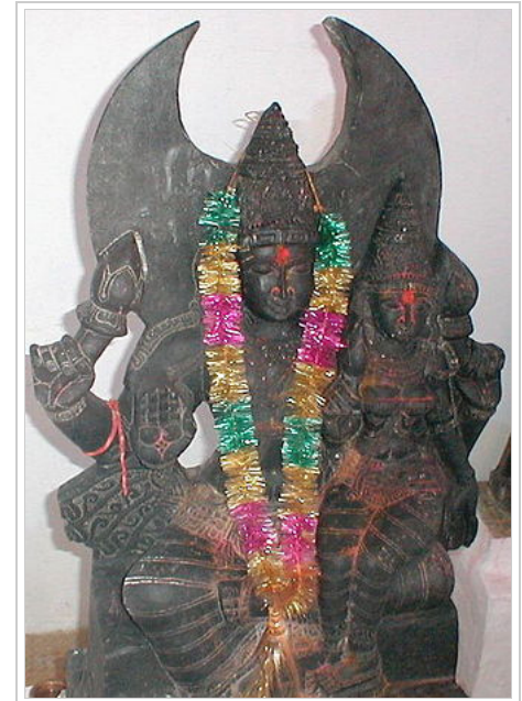
Chandra with Rohini

Chandra is known for having a series of disastrous love affairs. His first lover, Tara, was the wife of Brihaspati, the planet Jupiter. From their union, Tara became pregnant gives birth to Budha (a.k.a. the planet Mercury, not to be confused with the other Buddha). Because of how he was conceived, Budha hated his father and as Chandra also knew that Budha is his illegitimate son, he began to hate his son, and their rivalry continues to this day. For the sin of abducting another god's consort, Brahma banished Chandra to the outer atmosphere. This story illustrates allegorically the prohibition of intoxicants for Brahmins. [5] After that, Chandra, set out to marry the twenty-seven daughters of Daksha. Daksha allowed this on the condition that the moon not favor any daughter over the others. Chandra failed to do this, and Daksha placed a curse on him that took away his luster, which accounts for the moon's waxing and waning.