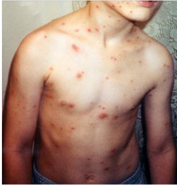
طفل مصاب بالحماق

B01. ( http://www.who.int/classifications/apps/icd