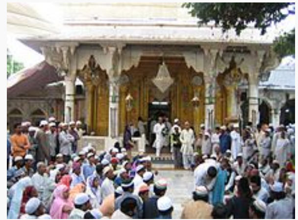
ഇന്ത്യയിലെ അജ്മെറിൽ മൊഹൂനുദ്ദീൻ ചിശ്തിയുടെ ദർഗാഹ്.