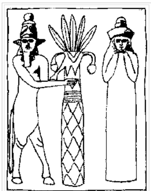
אנליל ואשתו נינליל

אֲנָלִיל (מילולית: אל הרוח) הוא אל הרוח, האוויר והסער במיתולוגיה השומרית. בנוסף היה גם פטרונה של העיר ניפור. אנליל, אנו ואאה (אנכי) היו שלושת האלים הראשיים בפנתאון השומרי. אנליל נקרא נסיך השמים ולידתו היא חלק מפרשת הבריאה השומרית אנומה אליש. הוא בנם הבכור של אן וכי, השמים והארץ.