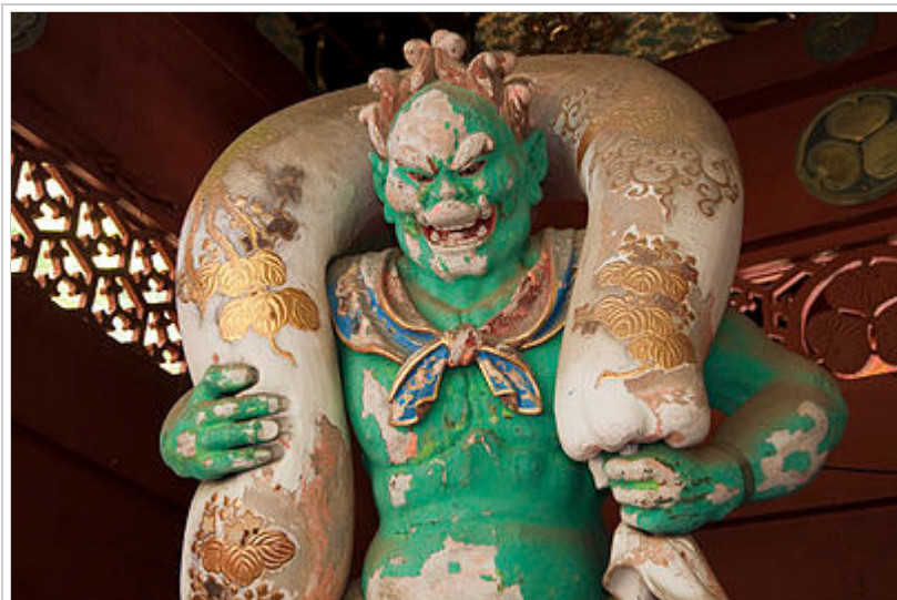
Statue at Taiyū-in in Nikkō