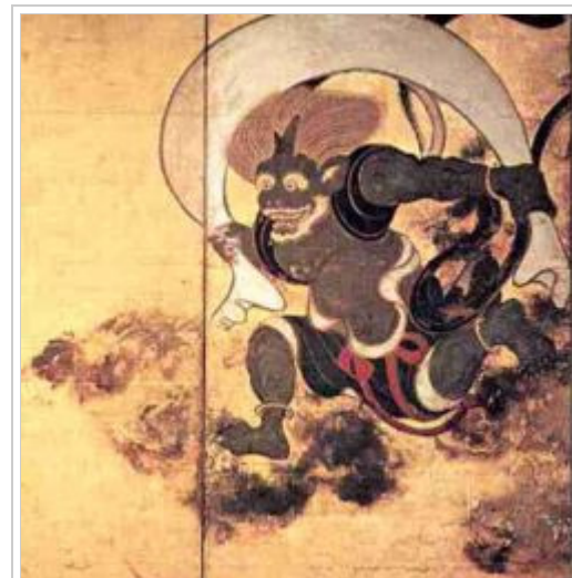
The Japanese wind god Fūjin, Sōtatsu, 17th century.

In Japanese art, the deity is often depicted together with Raijin, the god of lightning, thunder and storms.