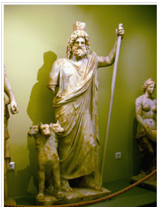
פסל של האדס וקרברוס במוזיאון הארכאולוגיה בכרתים