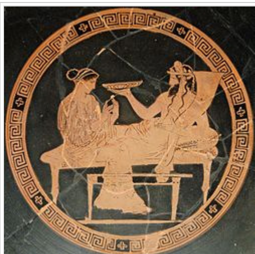
האדס ופרספונה, כד יווני, 430 לפנה"ס לערך

בפי הרומאים, האדס היווני נקרא פלוטו . אולם, בשונה מהאדס, פלוטו במקורו לא היה אל העולם התחתון, אלא היה אל הזהב, הכסף ומחצבים נוספים. (אל השאול הרומי המקורי היה אורקוס) מכיוון שחומרים אלו נכרו מבטן האדמה, פלוטו הפך להיות מזוהה עם העולם התחתון ובהדרגה היה לשליט המתים ולאדון השאול.