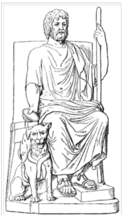
האדס, אל השאול, וכלבו קרברוס

ביוון העתיקה השם "האדס" התייחס בתחילה רק לאל השאול, אך בהמשך הוא החל לשמש גם כשמה של ממלכת המתים, משכנו של האל. ממלכה זו כללה בתחומיה מספר מדורים, לרבות שדות האליסיום (המקבילים לגן עדן), שדות הייסורים (המקביל לגיהנום) ושדות אספודל שלשם נשלחות הנשמות הרגילות. ישנו גם הגיהנום של האלים, התהום אליה הושלכו חלקיו של קרונוס והמפלצות החזקות ביותר- טרטרוס.