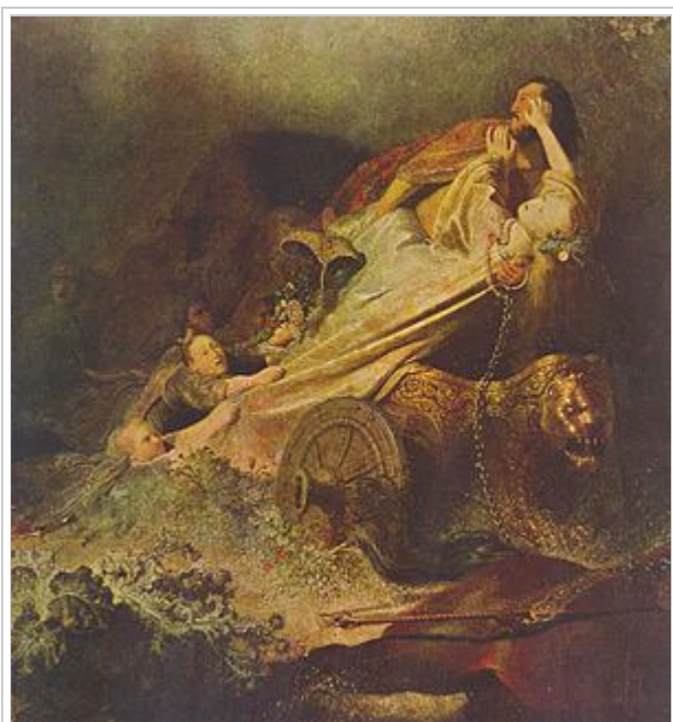
"חטיפתה של פרספונה"; ציור מאת רמברנדט. הציור מתאר את המיתוס הידוע ביותר אודות פלוטו ופרספונה, הם האדס ופרספונה היווניים

ביחס לאלים ודמויות מיתולוגיות אחרות, האדס ומקבילו הרומאי פלוטו, מופיע מעט מאוד ביצירות אמנות הן מימי יוון ורומא והן מתקופות מודרניות יותר, כמו תקופת הרנסאנס והנאו-קלאסיציזם. יצירות האמנות הבודדות שמציגות את דמויותיהם מתארות, על פי רוב, את חטיפתה של פרספונה.