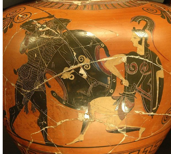
הרקולס נלחם באמזונה. פרט ציור על כד בסגנון הדמות השחורה, אטיקה, 530 לפנה"ס - 520 לפנה"ס. מוצג כיום במוזיאון הלובר שבפריז.