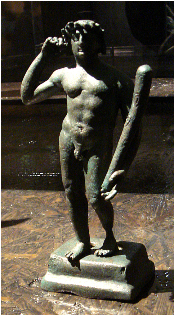
פסל ברונזה של הרקולס מהמאה השנייה לפנה"ס. מוצג כיום במוזיאון גימה שבפריז.