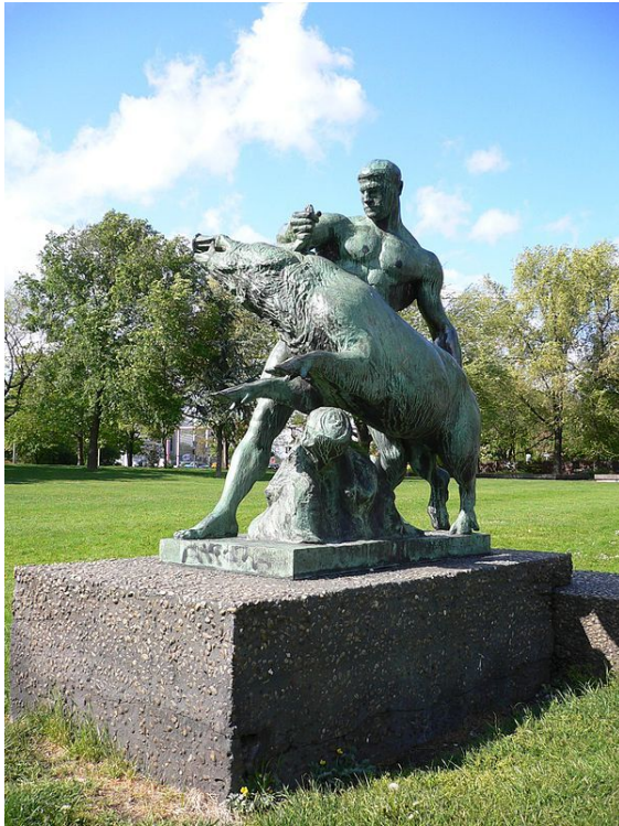
הרקולס נאבק בחזיר מהר ארימנטוס; פסל מאת לואיס טואילון, 1904

המשימה הבאה שהטיל אוריסתאוס על הרקולס הייתה להביא את חזיר הבר ששכן בהר ארימנטוס. החזיר היה פושט על אזור פסופיס וזורע הרג והרס. בדרך התארח הרקולס אצל הקנטאור פולוס שהגיש לו בשר צלוי, אף שקנטאורים נוהגים לאכול רק בשר נא. פולוס שמר אצלו את כד היין המשותף לכל הקנטאורים, אך חשש למזוג ממנו לאורחו. הרקולס הרגיע אותו ופתח את הכד. לריח היין הבלתי-מהול נזעקו הקנטאורים, חמושים בסלעים ועצי אשוח. כשפרצו למערה הניס אותם הרקולס בגזרי עצים בוערים ובמטחי חיצים.