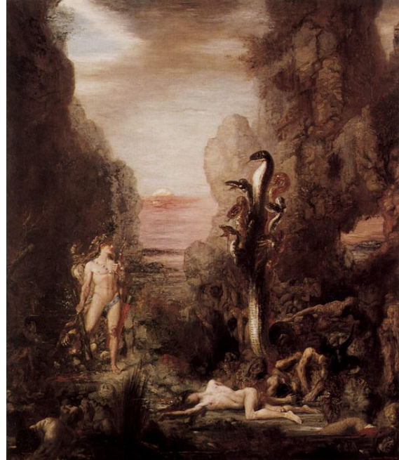
הרקולס וההידרה, תמונה מאת גוסטב מורו, 1867