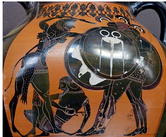
הרקולס נלחם בגריאון (אוריטיון הגוסס מוטל על הרצפה). פרט ציור על כד בסגנון הדמות השחורה, אטיקה, 540 לפנה"ס לערך. מוצג כיום במוזיאון הלובר שבפריז.

האמזונות. את ההגורה נתן לה ארס, אל המלחמה היווני. האמזונות היו שבט של נשים לוחמות. הן רכבו על סוסים ועסקו במלאכות גברים. לעתים הייתה אחת מהן פורשת, מוצאת גבר, שוכבת איתו וחוזרת למחנה. האמזונות גידלו רק את הנקבות ומן הזכרים היו נפטרות. הן נהגו לכרות את שדן הימני, כדי שלא יפריע להן לירות בקשת, ולכן נקראו אמזונות (נטולות שד). בשד השמאלי היניקו את בנותיהן.