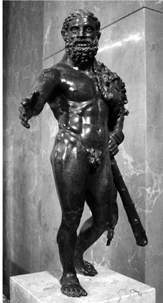
הרקולס- התקופה הרומית, ברונזה, מוזיאון הלובר

הרקולס (ביוונית: Ἡρακλῆς, הרַקְלֵס; בלטינית: Hercules ) הוא גיבור אלוהי מן המיתולוגיה היוונית והמיתולוגיה הרומית. בנם של ראש האלים היוונים זאוס ובת התמותה אלקמנה (אשת אמפיטריאון). אחד המפורסמים שבגיבוריה האגדיים של יוון העתיקה, מופת הגבריות, אבי שושלות המלכים בעולם ההלניסטי, אשר לחם בשם האלים האולימפיים נגד כוחות השאול, מפלצות ושאר כוחות ארכאיים. כך מוצג הרקולס בתרבות ההלניסטית והרומית כאיש אשר ניצחונותיו "הפכו את העולם למקום בטוח יותר לבני האדם".