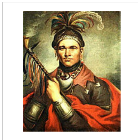
צ'יף שבט הסנקה קורנפלאנטר - דיוקן משנת 1796