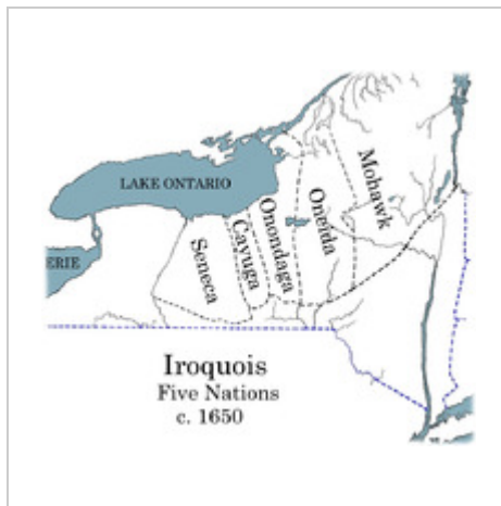
מפת מיקום השבטים ב-1650