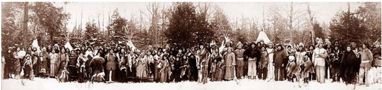
אינדיאנים משבטי האירוקווי בבאפלו, ניו יורק ב-1914