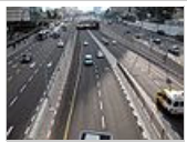
Λεωφόρος στο νότιο Τελ Αβίβ.