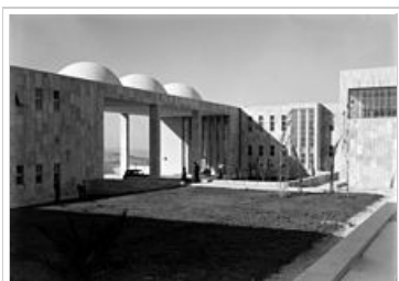
Φωτογραφία της δεκαετίας 1930. Το νεόκτιστο εβραϊκό νοσοκομείο Χαντάσα .