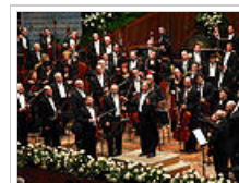
Το Τελ Αβίβ είναι η έδρα της παγκοσμίου κύρους Φιλαρμονικής Ορχήστρας του Ισραήλ

Ο πληθυσμός του Ισραήλ είναι 7.465.000 κάτοικοι (εκτίμηση 2009). Το Ισραήλ έχει δύο επίσημες γλώσσες, την Εβραϊκή και την Αραβική, που είναι συγγενικές σημιτικές γλώσσες. Εβραϊκά μιλά η εβραϊκή πλειονότητα (περίπου 80%) και Αραβικά οι Άραβες Ισραηλινοί και Εβραίοι που μετανάστευσαν από Αραβικές χώρες. Οι Άραβες Ισραηλινοί ανέρχονται στο 20%. Από αυτούς η συντριπτική πλειονότητα είναι μουσουλμάνοι και το 9% χριστιανοί. Το 22% του συνολικού πληθυσμού είναι Εβραίοι μετανάστες πρώτης γενιάς, κυρίως από την πρώην Σοβιετική Ένωση και άλλες πρώην κομμουνιστικές χώρες και, σε πολύ μικρότερο βαθμό, την Αιθιοπία. Γι' αυτό το λόγο μιλούνται επίσης Ρωσικά (έως και 20% του πληθυσμού), Ρουμανικά (έως και 500,000), Αμχαρικά (130,000 ομιλητές) κα..Στο Ισραήλ ζουν επίσης τουλάχιστον 200.000 οικονομικοί μετανάστες από χώρες της Αφρικής, Αν. Ευρώπης, Σρι Λάνκα, Φιλιπίνες κ.α.. Ο πληθυσμός είναι γενικά εξαιρετικά πολύγλωσσος.