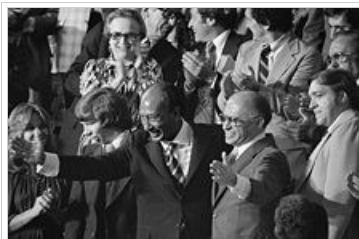
Ο Μεναχέμ Μπέγκιν (ισραηλινός πρωθυπουργός 1977-1983) με τον αιγύπτιο πρόεδρο Ανουάρ αλ-Σαντάτ στην πανηγυρική κοινή συνεδρίαση του αμερικανικού κοινοβουλίου όπου ανακοινώθηκε η συμφωνία του Καμπ Ντέιβιντ στις 18 Σεπτεμβρίου 1978.

σώθηκε με αμερικανική παρέμβαση). Ταυτόχρονα, από τα τέλη της δεκαετίας του 1960 έως τις μέρες μας, ένας μυστικός τρομοκρατικός πόλεμος με εκατέρωθεν δολοφονίες τόσο στο Ισραήλ και τη Δυτική Όχθη όσο και σε τρίτες χώρες εξελίσσεται ανάμεσα σε διάφορες αραβικές οργανώσεις και την ισραηλινή μυστική υπηρεσία "Μοσάντ". Για παράδειγμα η δολοφονία ένδεκα Ισραηλινών αθλητών στους Ολυμπιακούς Αγώνες του Μονάχου το 1972 και, πρόσφατα, η δολοφονία παλαιστίνιου προμηθευτού όπλων της Χαμάς στο Ντουμπάι.