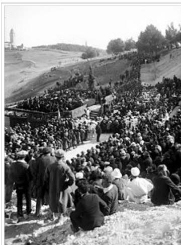
1925. Τελετή θεμελίωσης του Εβραϊκού Πανεπιστημίου Ιερουσαλήμ .

Οι Εβραίοι ζουν εδώ και χιλιάδες χρόνια στην περιοχή του σύγχρονου Ισραήλ και στην αρχαιότητα ήταν πλειονότητα μέχρις ότου εκδιώχθηκαν από τους Ρωμαίους και κατοίκησαν σε διάφορα μέρη του κόσμου. Οι Ρωμαίοι μετονόμασαν τη χώρα από Ιουδαία σε Παλαιστίνη κατά την "Παλαιστίνη Συρία" του Ηροδότου. Η περιοχή κατακτήθηκε μεταγενέστερα από Βυζαντινούς (330-640 μ.χ.), κατόπιν Άραβες (7ο αιώνα μ.χ.), Σελτζούκους Τούρκους (1071 μ.χ.), Σταυροφόρους Ευρωπαίους (1099 - 1187μ.χ.), Μαμελούκους Αιγύπτιους (περί το 1250 - 1516 μ.χ.), Οθωμανούς (1516-1831), Αιγύπτιους (1831-1841) και πάλι Οθωμανούς/Τούρκους (1841 - 1917) ενώ διετέλεσε βρετανικό προτεκτοράτο μεταξύ 1920 - 1948. Δηλαδή η περιοχή της Παλαιστίνης παρέμεινε ως επί το πλείστον μουσουλμανική κατά πλειονότητα των κατοίκων της από το 1270 μ.Χ. έως και τον 20ο αιώνα.