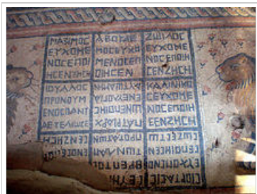
Ελληνιστική επιγραφή του 337-286 πΧ στο δάπεδο σημερινής συναγωγής στην Τιβεριάδα.