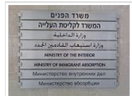
Πινακίδα στο Υπουργείο Εσωτερικών και Ενσωμάτωσης Μεταναστών. Από πάνω προς τα κάτω: Εβραϊκά, Αραβικά, Αγγλικά, και Ρωσικά.

Το σιδηροδρομικό δίκτυο μέχρι τη δεκαετία του 1990 βρισκόταν σε πτώση. Μετέπειτα ξεκίνησε ένα πρόγραμμα ανανέωσης. Οι κρατικοί σιδηρόδρομοι Israel Railways διαθέτουν σήμερα σύγχρονο τροχαίο υλικό. Επίσης υπάρχει το δίκτυο λεωφορείων της Egged , που λειτουργεί