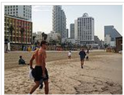
Πρωί στην παραλία του Τελ Αβίβ.

Το Ισραήλ είναι ανεπτυγμένη χώρα με υψηλό κατά κεφαλήν εισόδημα (λίγο μεγαλύτερο από αυτό της Ελλάδας, βάσει στοιχείων του 2010). Έχει σημαντική και ταχύτατα αναπτυσσόμενη βιομηχανία υψηλής τεχνολογίας - ιδιαίτερα πληροφορικής, όπλων και εναλλακτικής ενέργειας - καθώς και σημαντικό τομέα υπηρεσιών. Ο τουρισμός, ιδιαίτερα ο θρησκευτικός, είναι υπολογίσιμη πηγή εσόδων. Οι μεγάλες στρατιωτικές δαπάνες του επιχορηγούνται ετήσια από τις ΗΠΑ. Η χώρα διαθέτει μια έντονα ανταγωνιστική οικονομία και κατατάσσεται 3ο σε επιχειρηματικότητα στο World Economic Forum's Global Competitiveness Report. Μετά τις Αμερικανικές οι Ισραηλινές εταιρίες έρχονται 2ες σε εγγραφές στο χρηματιστήριο της Νέας Υόρκης. Μονάδες παραγωγής διατηρούν μεγάλες