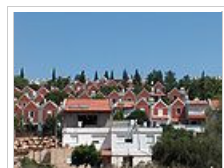
Αεροφωτογραφία του κεντρικού Τελ Αβίβ.

Στο δείκτη ανθρώπινης ανάπτυξης του 2007 το Ισραήλ κατατάχθηκε στην 23η θέση, ακριβώς μία θέση πάνω από την Ελλάδα. Σε ευρωπαϊκά επίπεδα βρίσκονται η γενικότερη υποδομή του κράτους, η δημόσια περίθαλψη, η εκπαίδευση, και η συγκοινωνία. Το προσδόκιμο ζωής στο σύνολο του πληθυσμού ήταν σύμφωνα με εκτιμήσεις του 2013 τα 81,17 χρόνια (78,96 χρόνια οι άνδρες και 83,49 οι γυναίκες). [3]