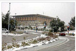
Η ισραηλινή βουλή Κνέσετ, χιονισμένη.

Το πολίτευμα του Ισραήλ είναι η δημοκρατία. Αρχηγός Κράτους είναι ο Πρόεδρος, ο οποίος εκλέγεται από το Κοινοβούλιο (Κνέσετ) -το οποίο απαρτίζεται από 120 μέλη- αλλά η πραγματική εξουσία είναι στα χέρια του Πρωθυπουργού. Η χώρα δεν έχει επίσημο Σύνταγμα. Όμως, μεταξύ 1958-1998 η Κνέσετ νομοθέτησε ενένεα 'Βασικούς Νόμους' (Εβραϊκά hūkēi ha-yəʿasəd תוס' יריב ) αναφορικά με τη δομή και τους θεσμούς του κράτους. Το 1992 ψηφίστηκαν ακόμα δύο νέοι Βασικοί Νόμοι αναφορικά με τα θεμελιώδη δικαιώματα των πολιτών οι οποίοι υπήρξαν η βάση για τη μετέπειτα απόφαση του Ανώτατου Δικαστηρίου της χώρας με την οποία διακήρυξε την αρμοδιότητά του να εξασκεί έλεγχο συνταγματικότητας των νόμων. Το 1998 ο Πρόεδρος του Ανώτατου Δικαστηρίου, σε μια ακόμα "συνταγματική επανάσταση," ανακήρυξε ότι αυτοί οι Βασικοί Νόμοι είναι συνταγματικά κατοχυρωμένοι.