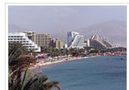
Παραλιακή άποψη του Ελάτ.