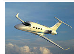
Αεροσκάφος ισραηλινής κατασκευής Avocet ProJet

Το Ισραήλ είναι ανεπτυγμένη χώρα με υψηλό κατά κεφαλήν εισόδημα (λίγο μεγαλύτερο από αυτό της Ελλάδας, βάσει στοιχείων του 2010). Έχει σημαντική και ταχύτατα αναπτυσσόμενη βιομηχανία υψηλής τεχνολογίας - ιδιαίτερα πληροφορικής, όπλων και εναλλακτικής ενέργειας - καθώς και σημαντικό τομέα υπηρεσιών. Ο τουρισμός, ιδιαίτερα ο θρησκευτικός, είναι υπολογίσιμη πηγή εσόδων. Οι μεγάλες στρατιωτικές δαπάνες του επιχορηγούνται ετήσια από τις ΗΠΑ. Η χώρα διαθέτει μια έντονα ανταγωνιστική οικονομία και κατατάσσεται 3ο σε επιχειρηματικότητα στο World Economic Forum's Global Competitiveness Report. Μετά τις Αμερικανικές οι Ισραηλινές εταιρίες έρχονται 2ες σε εγγραφές στο χρηματιστήριο της Νέας Υόρκης. Μονάδες παραγωγής διατηρούν μεγάλες