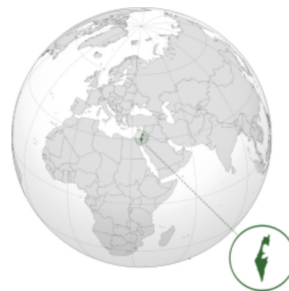
Θέση του Ισραήλ στη Μέση Ανατολή