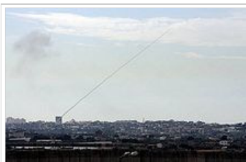
12 Δεκεμβρίου 2008. Ρουκέτα εκτοξεύεται από τη Γάζα εναντίον κατοικημένων περιοχών στο Ισραήλ.

Γκιλάντ Σαλίτ, απήχθη στα σύνορα με τη Γάζα. Ο ομηρία του συνεχίζεται ως τις μέρες μας.