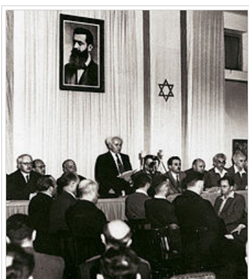
Ο Δαβίδ Μπεν Γκουριόν ανακηρύσσει την ανεξαρτησία του Ισραήλ στις 14 Μαΐου 1948, κάτω από την εικόνα του Θεόδωρου Χερτσλ οραματιστή του σύγχρονου εβραϊκού κράτους.

αιώνα το σιωνιστικό κίνημα (που είχε ιδρυθεί το 1897 με σκοπό την ίδρυση του Ισραήλ), απαίτησε τη δημιουργία ενός ανεξάρτητου εβραϊκού κράτους, ενώ ανέλαβε την παράνομη μετανάστευση εκατοντάδων χιλιάδων Εβραίων στην Παλαιστίνη, την οποία προσπάθησαν αρχικά να σταματήσουν οι Βρετανοί οι οποίοι είχαν μετατρέψει την περιοχή σε προτεκτοράτο. Το 1917 όμως η Βρετανία άλλαξε στάση και ο υπουργός εξωτερικών Άρθουρ Τζέιμς Μπάλφουρ δήλωσε πως υποστηρίζει τη μελλοντική ίδρυση Εβραϊκού κράτους στην Παλαιστίνη "στο βαθμό που δεν επηρεάζονται οι Άραβες κάτοικοι". Η Εβραϊκή παράνομη μετανάστευση συνεχίστηκε και αυξήθηκε σημαντικά στα επόμενα χρόνια και πολλές καθαρά εβραϊκές νέες πόλεις και ιδρύματα χτίστηκαν.