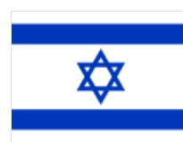
Σημαία του Ισραήλ