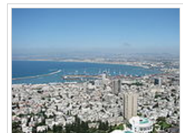
Πανοραμική άποψη της Χάιφα.