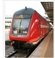
Διώροφη αμαξοστοιχία προστασιακού σιδηροδρόμου.

Το μεγαλύτερο αεροδρόμιο της χώρας είναι το Διεθνές Αεροδρόμιο Μπεν Γκουριόν. Βρίσκεται στην πόλη Lod στη μητροπολιτική περιοχή του Τελ Αβίβ και είναι έδρα των αεροπορικών εταιριών El Al, Sun D'Or, Israir, CAL και Arkia. θεωρείται από τα ασφαλέστερα αεροδρόμια παγκοσμίως λόγω των εκτεταμένων ελέγχων. Εσωτερικές πτήσεις πραγματοποιούνται μεταξύ Εϊλάτ-Τελ Αβίβ και Εϊλάτ-Χάιφα.