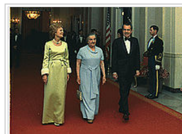
Γκόλντα Μέιρ ισραηλινή πρωθυπουργός 1969-1974. Φωτογραφία με τους Ρίτσαρντ και Πατ Νίξον το 1973.