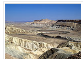
Κουλάδα στην έρημο Νέγκεβ.