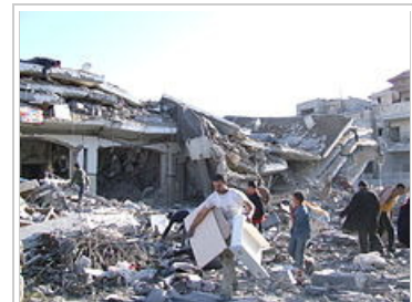
7 Ιανουαρίου 2009. Άμαχοι άνθρωποι στη Γάζα αμέσως μετά από εκτεταμένο ισραηλινό βομβαρδισμό.

Στις 19 Δεκεμβρίου του 2008 η Χαμάς ανακοίνωσε μονομερώς τον τερματισμό της εκκευρίας που είχε κηρυχθεί με το Ισραήλ και ταυτόχρονα δεκάδες αυτοσχέδιες οβίδες από τη Γάζα άρχισαν να πέφτουν καθημερινά μέσα και γύρω από τη γειτονική Ισραηλινή πόλη Σντερότ στέλνοντας τον πανικόβλητο κόσμο στα καταφύγια αλλά προξενώντας μόνον ένα θάνατο και ελάχιστες υλικές ζημιές. [5] Μια εβδομάδα σχεδόν μετά τη λήξη της εξάμηνης εκκευρίας, η ισραηλινή αεροπορία εξαπέλυσε 30 πυραύλους εναντίον στόχων στη Λωρίδα της Γάζας. Οι νεκροί ξεπέρασαν τους 1.400, ενώ τουλάχιστον 5.100 άνθρωποι τραυματίστηκαν. [6] Το Ισραήλ κατηγορήθηκε για προφανή χρήση του απαγορευμένου λευκού φωσφόρου στις επιθέσεις του κατά της Γάζας και έγιναν παγκόσμιες διαδηλώσεις οργής κατά των επιθέσεων στη Γάζα ακόμη και από Εβραίους εκτός του Ισραήλ [7] . Μεταξύ των νεκρών ήταν και ο επικεφαλής της Αστυνομίας στην πόλη, μέλος της Χαμάς και πολλοί άμαχοι πολίτες και παιδιά. Η περιοχή της Γάζας δεν έχει ανοικοδομηθεί έκτοτε και παραμένει σε αποκλεισμό, αντιμετωπίζοντας προβλήματα σίτισης, ύδρευσης & υγιεινής. Το Ισραήλ κατηγορήθηκε επίσημα από όλες τις ισλαμικές χώρες, την Βολιβία, τον Ισημερινό (Εκουαδόρ), και την Βενεζουέλα η οποία μάλιστα διέκοψε τις διπλωματικές σχέσεις με το Ισραήλ.