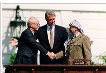
Ο Γιτζάκ Ράμπιν (εβραϊκά: Γιτσαχάκ Ραμπίν) (ισραηλινός πρωθυπουργός 1992-1995), ο Μπιλ Κλίντον και ο Γιάσερ Αραφάτ στη Συμφωνία του Όσλο στις 13 Σεπτεμβρίου 1993.

Η Ιντιφάντα, η συνεχιζόμενη ένοπλη εξέγερση Παλαιστίνιων στα κατεχόμενα από το Ισραήλ εδάφη της Δυτικής Όχθης, ξεκίνησε το 1987 και συνεχίζεται σε μικρότερη κλίμακα έως τις μέρες μας.