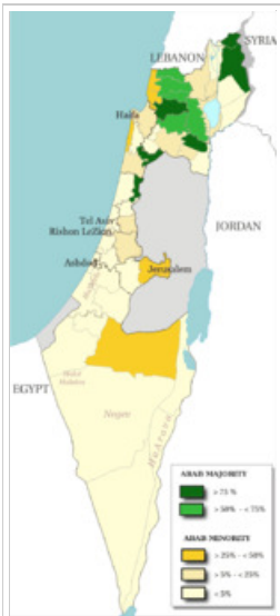
Χάρτης του Ισραήλ στα αγγλικά που δείχνει τις περιοχές όπου η πλειονότητα είναι Εβραίοι (κίτρινο) και Άραβες (πράσινο) ( έτος 2000)

έγιναν Εβραίοι, μια διαδικασία που διαρκεί έως και ένα έτος θρησκευτικών σπουδών). Έτσι περίπου 300.000 από το 1.000.000 των ρωσόφωνων πολιτών δεν αναγνωρίζονται ως 'γνήσιοι Εβραίοι' και έτσι δεν μπορούν να παντρευτούν, να υιοθετήσουν κ.α. σύμφωνα με το οικογενειακό δίκαιο της χώρας που παραμένει θρησκευτικό.