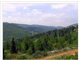
Βουνά κοντά στην Ιερουσαλήμ.

Το κλίμα του Ισραήλ είναι μεσογειακό κοντά στη θάλασσα, με πολύ ζεστά καλοκαίρια και βραχείς, ήπιους χειμώνες. Στα υψώματα της Ιερουσαλήμ -όπως και στην κατεχόμενη Δυτική Όχθη- κάνει περισσότερο κρύο και κατά καιρούς χιονίζει. Στο νότο το κλίμα είναι πολύ πιο ξηρό και υπάρχει έρημος.