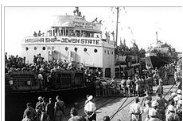
Το πλοίο 'Κράτος του Ισραήλ' ιδιοκτησίας της οργάνωσης 'Χαγκανά' αποβιβάζει Εβραίους μετανάστες στο λιμάνι της Χάιφα το 1947.