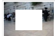
Εβραίοι προσκυνητές στο Τείχος των Δακρύων στην Ιερουσαλήμ.