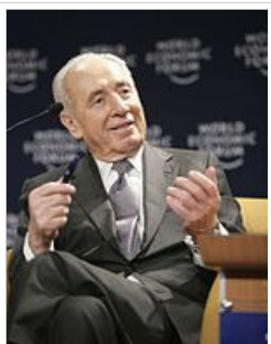
Ο Πρόεδρος του Ισραήλ Σιμόν Πέρες (2007)

Δικαίωμα ψήφου στις εκλογές έχουν όσες και όσοι είναι ηλικίας 18 ετών και άνω. [3] Η Βουλή, που ονομάζεται " Κνέσετ ", έχει 120 μέλη, εκλέγεται με το σύστημα της απλής αναλογικής. Η κυβέρνηση εκλέγεται από τη βουλή, όπως και ο Πρόεδρος της χώρας. Η πραγματική πολιτική εξουσία ασκείται από τον πρωθυπουργό και τους υπουργούς ενώ ο πρόεδρος έχει μόνο συμβολικά την ανώτατη πολιτειακή θέση.