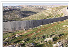
Το τείχος ασφαλείας που κατασκεύασε το Ισραήλ.

με ένα ανεξάρτητο παλαιστινιακό κράτος και την εκλαΐκευση του οικογενειακού δικαίου που παραμένει θρησκευτικό (πχ δεν υπάρχει πολιτικός γάμος ενώ οι γυναίκες δεν δικαιούνται να ζητήσουν διαζύγιο). Οι δε δεύτεροι, ακολουθώντας την Παλαιά Διαθήκη θεωρούν ότι ο Θεός "υποσχέθηκε" στους Εβραίους όλη την περιοχή της Βιβλικής Γης Χαναάν', μέρος της οποίας είναι και πατρίδα των Παλαιστινίων, και γι' αυτό το λόγο εποικίζουν διαρκώς τη Δυτική Όχθη κατά παράβαση του διεθνούς δικαίου αλλά και απαιτούν να γίνει ο Ιουδαϊκός νόμος η αποκλειστική πηγή δικαίου της χώρας. Λόγω του εκλογικού συστήματος (που είναι η απλή αναλογική) όλες οι κυβερνήσεις μέχρι σήμερα είναι πολυ-κομματικές και περιλαμβάνουν και τα μικρά αλλά πολλά θρησκευτικά κόμματα. Έτσι, ενώ τα κόμματα που πλειοψηφούν είναι κοσμικά, βασίζονται στην