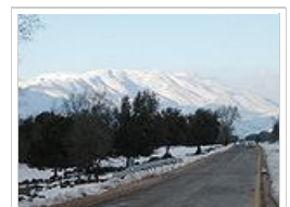
Το Όρος Ερμών.

Το Ισραήλ έχει στενόμακρο σχήμα και καταλαμβάνει έκταση 20.770 τ.χλμ. Το βορειο-νότιο μήκος της χώρας φτάνει τα 424 χλμ. ενώ στο στενότερο ανατολικο-δυτικό σημείο μόλις τα 15χλμ. Ανατολικά συνορεύει με τη Δυτική Όχθη, τη Συρία και την Ιορδανία. Βόρεια έχει το Λίβανο, νότια την Αίγυπτο και την Ερυθρά Θάλασσα ενώ δυτικά συνορεύει με την Γάζα και βρέχεται από τη Μεσόγειο θάλασσα. Το Ισραήλ έχει προσαρτήσει στο έδαφος του, μονομερώς και χωρίς διεθνή αναγνώριση, ακόμα 1.150 τ.χλμ Συριακού εδάφους τα λεγόμενα