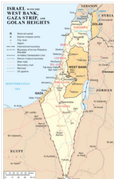
Χάρτης στα αγγλικά που δείχνει το Ισραήλ, τη Δυτική Όχθη, τη Γάζα και τα Υψώματα του Γκολάν.

Πολλά στοιχεία συνάδουν ώστε το Ισραήλ να έχει μια συγκεκριμένη αισθητική και ατμόσφαιρα που θα μπορούσε να χαρακτηριστεί ως 'ασφαλειο-κεντρική'. Όλοι οι πολίτες, πλην των Αράβων, στρατεύονται υποχρεωτικά. Η αρχική στρατιωτική θητεία διαρκεί τρία χρόνια για τους άνδρες και δύο για τις γυναίκες. Όμως πολλοί συνεχίζουν να καλούνται συχνά ως έφεδροι για αρκετές εβδομάδες ετησίως και επί σειρά ετών. Οι περισσότεροι πολίτες έχουν συγγενείς που έπεσαν θύματα είτε των Γερμανών ναζί στο Ολοκαύτωμα είτε στους διάφορους Ισραηλινο-αραβικούς πολέμους είτε σε τρομοκρατικές επιχειρήσεις παλαιστινίων. Σημαντικά τμήματα σύγχρονων ισραηλινών πόλεων κτίστηκαν πάνω από ερειπωμένους Αραβικούς οικισμούς μετά τη φυγή των Αράβων κατοίκων - είτε κατόπιν διωγμού είτε εθελούσια (αλλά κατ' αυτούς προσωρινά). Παρότι αυτό το φαινόμενο συναντάται σε πολλά κράτη, εντυπωσιάζει το γεγονός ότι το Ισραήλ ιδρύθηκε πριν μόλις μερικές δεκαετίες και πολλοί από τους Παλαιστίνιους πρώην ιδιοκτήτες- και έκτοτε πρόσφυγες σε γειτονικές χώρες - ζουν ακόμη με την προσμονή της 'επιστροφής' σε σπίτια που κατεδαφίστηκαν πριν δεκαετίες και στη θέση των οποίων υπάρχουν τώρα ισραηλινές πόλεις, πανεπιστήμια, μονάδες παραγωγής κλπ..