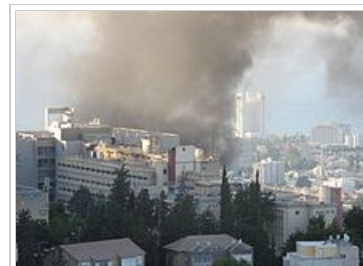
14 Αυγούστου 2006: πύραυλος "κατιούσα" της Χεζμπολά εκτοξευμένος από τον Λίβανο χτυπά την ισραηλινή πόλη Χάιφα την τελευταία μέρα του πολέμου.

Τον Ιούνιο του 2006 μαχητές της Σιϊτικής οργάνωσης του Λιβάνου Χεζμπολά πρώτα σκότωσαν πέντε και απήγαγαν δύο Ισραηλινούς στρατιώτες στα ισραηλινο-λιβανέζικα σύνορα και στη συνέχεια εξαπέλυσαν καταιγισμό οβίδων αλλά και πυραύλων Ιρανικής προέλευσης που έπληξαν μεγάλες Ισραηλινές πόλεις στο βορρά όπως η Χάιφα σκοτώνοντας 43 Ισραηλινούς πολίτες, προξενώντας υλικές ζημιές και μεγάλο πανικό στον άμαχο πληθυσμό. Περίπου 200.000-500.000 Ισραηλινοί χρειάστηκε να εγκαταλείψουν προσωρινά τα σπίτια τους. Το Ισραήλ απάντησε με ένα σκληρότατο βομβαρδισμό εκτεταμένων στρατιωτικών αλλά και πολιτικών στόχων στο Λίβανο από ξηρά, αέρα και θάλασσα που προξένησε πολύ μεγάλες απώλειες αμάχων και τεράστιες υλικές ζημιές. Το Ισραήλ κατηγορήθηκε από πολλές χώρες για χρήση βίας εκτός μέτρου αλλά οι ΗΠΑ απέτρεψαν την καταδίκη του από το Συμβούλιο Ασφαλείας του ΟΗΕ εξασκώντας δικαίωμα 'βέτο.' Τον ίδιο μήνα, Ιούνιο 2006, ένας άλλος Ισραηλινός στρατιώτης, ο