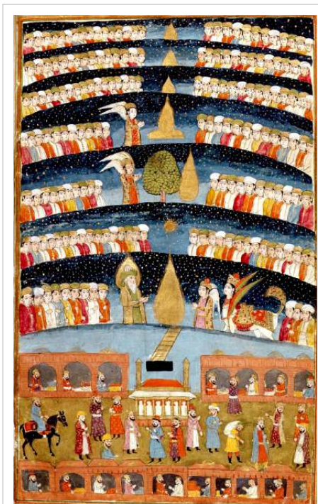
An artists representation of "Mohammed's Paradise". A Persian miniature from The History of Mohammed , Bibliothèque nationale de France, Paris.

Or do ye think that ye shall enter the Garden (of bliss) without such (trials) as came to those who passed away before you? They encountered suffering and adversity, and were so shaken in spirit that even the Messenger and those of faith who were with him cried: "When (will come) the help of Allah?" Ah! Verily, the help of