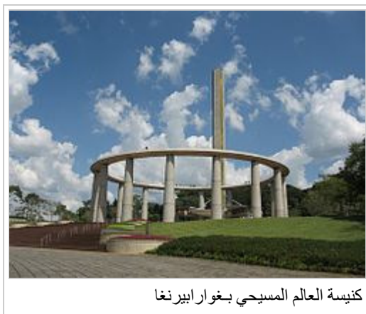
كنيسة العالم المسيحي بغوارابيرنغا

مجلوبة من "http://ar.wikipedia.org/w/index.php?title=كنيسة_العالم_المسيحي&oldid=12228870"