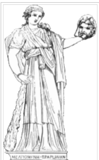
המוזה מלפומנה , פטרונית הטרגדיה, מחזיקה מסכת תיאטרון בידה.