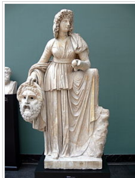
Roman statue of Melpomene, 2nd century AD. The muse is shown in a long-sleeved garment with a high belt, clothing that was associated with tragic actors. Her wreath of vines and grapes alludes to Dionysus, the god of the theatre.

In Roman and Greek poetry, it was traditional to invoke the goddess Melpomene so that one might create beautiful lyrical phrases (see Horace's Odes).