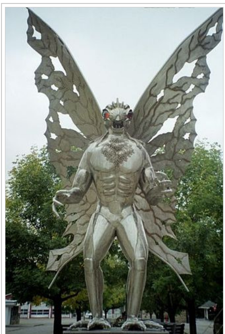
تمثال الرجل العثة

أثار جدلا واسعا في عالم ماوراء الطبيعة، ويعد من أكثر ظواهر هذا العلم غموضا وإثارة للجدل. وأشهر الحوادث المسجلة لهذا المخلوق هو ماحدث في 12 نوفمبر من عام 1966 بمدينة بوينت بليزنت في ولاية غرب فرجينيا الأمريكية، حين ادعى رجل أسمة "نيويل بارتريدج" أنه شاهد مخلوق غريب بجانب مخزن منزله يشبه الإنسان ولكنه أكثر ضخامة منه وله جناحان كبيران منتشيان خلف ظهره!! ولم يتحقق نيويل بارتريدج من حقيقة هذا المخلوق لأنه سرعان ماعاد مذعورا إلى منزله تاركا كلبه في الخارج مع هذا المخلوق الغريب.