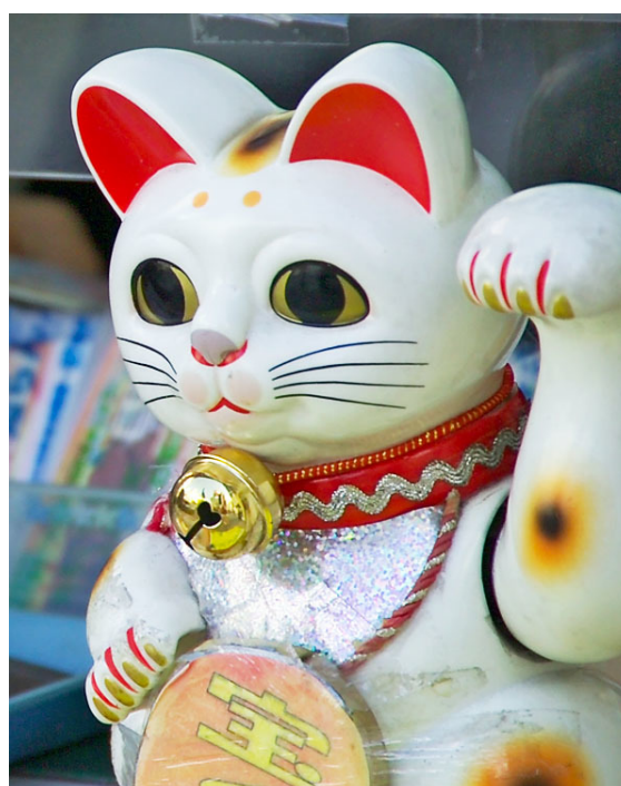
מנקי נקו בטוקיו מזמין לקוחות לקנות כרטיסי הגרלה.

לעתים מחזיק המנקי נקו מטבע בכפו, בדרך כלל מטבע זהב בשם "קופן" שהיה בשימוש בתקופת אדו. על הקובן שמחזיק המנקי נקו נקוב לרוב ערך של כ-10 מיליארד דולר. המטבע קשור לתפקיד החתול: הבאת מזל טוב וממון. מנקי נקו נמצאו בבנקים ביפן לפחות משנות התשעים של המאה ה-19, בדומה לקופות החיסכון בצורת חזיר.