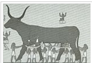
Η Νουτ ως αγελάδα

των σαρκοφάγων, το έναστρο σώμα της ζωγραφιζόταν πάνω από τη μούμια, για να επαγρυπνεί με τη μητρική φροντίδα της. Με τη μεσολάβησή της ο νεκρός αναγεννάται ως άστρο στον ουρανό [6] . Κόρη και μητέρα ταυτόχρονα του Ήλιου στις διαφορετικές μορφές του, είναι παρούσα κατά την ανάδυση του Κεπερά από τον Κάτω Κόσμο, ενώ το αίμα του κόλπου της κατά τη γέννηση του ήλιου, του δίνει τη ροδόχροα λάμψη της αυγής [7]