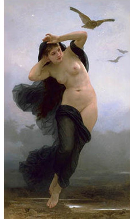
La Nuit by William-Adolphe Bouguereau (1883)