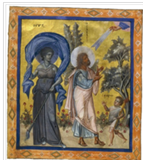
Nyx, as represented in the 10th-century Paris Psalter at the side of the Prophet Isaiah