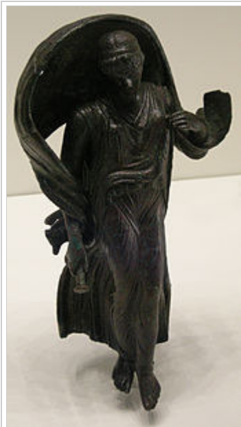
Roman-era bronze statuette of Nyx velificans or Selene (Getty Villa)