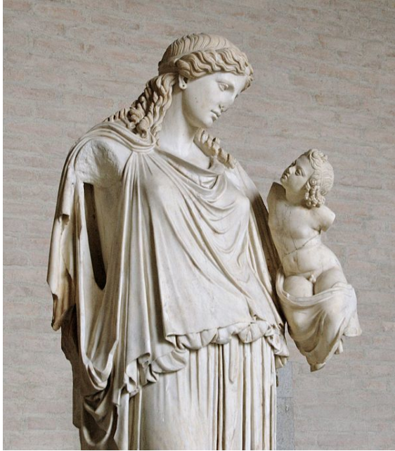
Eirene with the infant Ploutos: Roman copy after Kephisodotos' votive statue, c. 370BCE, in the Agora, Athens

Ploutos (Greek: Πλοῦτος, “Wealth”), usually Roman-