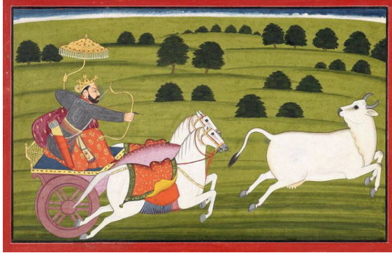
Prithu chasing Prithvi, who is in the form of a cow.

Prithvi (Sanskrit: पृथ्वी pr̥thvī , also पृथिवी pr̥thivī ) is the