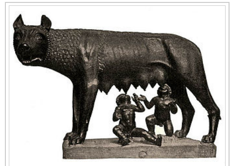
Capitoline Wolf. Traditional scholarship says the wolf-figure is Etruscan, 5th century BC, with figures of Romulus and Remus added in the 15th century AD by Antonio Pollaiuolo. Recent studies suggest that the wolf may be a medieval sculpture dating from the 13th century AD. [1]

The legend as a whole encapsulates Rome's ideas of itself, its origins and moral values. For modern scholarship, it remains one of the most complex and problematic of all foundation myths, particularly Remus's death. Ancient historians had no doubt that Romulus gave his name to the city. Most modern historians believe his name a back-formation from the name Rome; the basis for Remus's name and role remain subjects of ancient and modern speculation. The myth was fully developed into something like an "official", chronological version in the Late Republican and early Imperial era; Roman historians dated the city's foundation to between 758 and 728 BC, and Plutarch reckoned the twins' birth year as c. 27/28 March 771 BC. An earlier tradition that gave Romulus a distant ancestor in the semi-divine Trojan prince Aeneas was further embellished, and Romulus was made the direct ancestor of Rome's first Imperial dynasty. Possible historical bases for the broad mythological narrative remain unclear and disputed. [4] The image of the she-wolf suckling the divinely fathered twins became an iconic representation of the city and its founding legend, making Romulus and Remus preeminent among the feral children of ancient mythography.