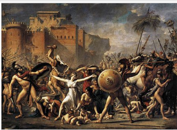
The Sabine Women, by Jacques-Louis David

The Sabine women themselves then intervened to beg for unity between Sabines and Romans. A truce was made, then peace. The Romans based themselves on the Palatine and the Sabines on the Quirinal, with Romulus and Tatius as joint kings and the Comitium as the common centre of government and culture. 100 Sabine elders and clan leaders joined the Patrician Senate. The Sabines adopted the Roman calendar, and the Romans adopted the armour and oblong shield of the Sabines. The legions were doubled in size.