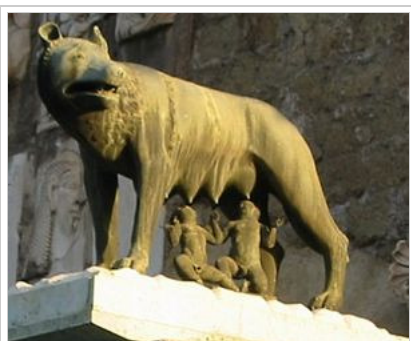
פסל הזאבה הקפיטולינית מניקה את התינוקות רמוס ורומולוס

רמוס ורומולוס (Romulus & Remus) הם דמויות מההיסטוריה המיתולוגית של רומא, שיסודה של עיר זו מיוחס להם. השניים היו אחים תאומים, בניהם של האל מרס, אל המלחמה הרומי, וריאה סילביה, בתו של המלך נומיטור וכוהנת וסטה.