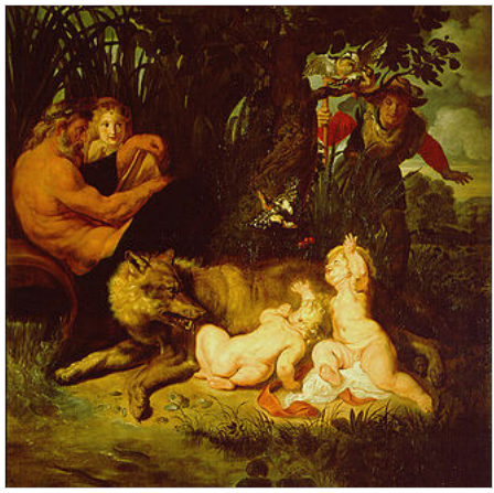
Faustulus (to the right of picture) discovers Romulus and Remus with the she-wolf and woodpecker. Their mother Rhea Silvia and the river-god Tiberinus witness the moment. Painting by Peter Paul Rubens, c. 1616 (Capitoline Museums).

In all versions of the founding myth, the twins grew up as shepherds. While tending their flocks, they came into conflict with the shepherds of Amulius. Remus was captured and brought before Amulius, who eventually discovers his identity. Romulus raised a band of shepherds to liberate his brother and Amulius was killed. Romulus and Remus were conjointly offered the crown but they refused it and restored Numitor to the throne. They left to found their own city, but could not agree on its location; Romulus preferred the Palatine Hill, Remus preferred the Aventine Hill. They agreed to seek the will of the gods in this matter, through augury. Each took position on his respective hill and prepared a sacred space there. Remus saw six auspicious birds; but Romulus saw twelve. Romulus claimed superior augury as the divine basis of his right to decide. Remus made a counterclaim: he saw his six vultures first. Romulus set to work with his supporters, digging a trench (or building a wall, according to Dionysius) around the Palatine to define his city boundary.