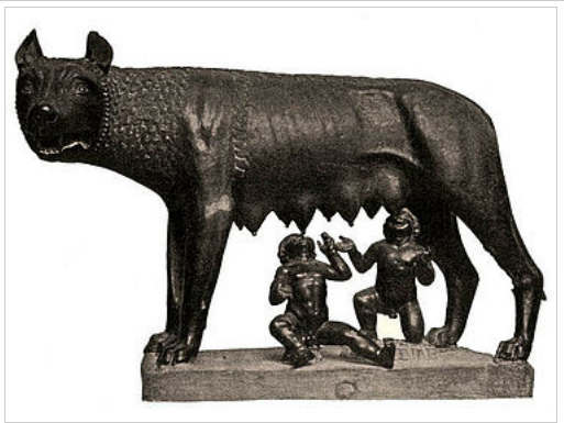
פסל הזאבה הקפיטולינית, שמתוארך למאה 5 לפנה"ס, ומוצג עד היום במוזיאון הקפיטוליני ברומא.

דוגמה נוספת היא פסל המתכת של אלכסנדר קאלדר משנת 1928 המוצג במוזיאון הירשהורן שבסמית'סוניאן. הפסל מתאר בצורה מופשטת את דמויותיהם של רמוס ורומולוס והזאבה.