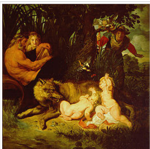
رموس و رمولوس در حال شیر خوردن از پستان ماده‌گرگ؛ در سوی چپ نگارهٔ رئا سیلویا دیده می‌شود. تابلو ژُملو و رمو اثر پتر پاول روبنز

اسطوره‌های رومی دو برادر بنیادگذار شهر رم بودند.