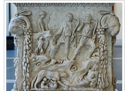
Altar from Ostia showing the discovery of Romulus and Remus (now at the Palazzo Massimo alle Terme).