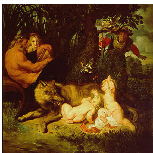
ציור של פטר פאול רובנס המתאר את התינוקות רמוס ורומולוס, רועה הצאן, הזאבה, וברקע מרס וסילביה, הוריהם של התינוקות.