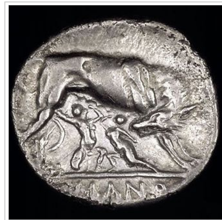
Romulus and Remus. Silver didrachm (6.44 g). c. 269–266 BC