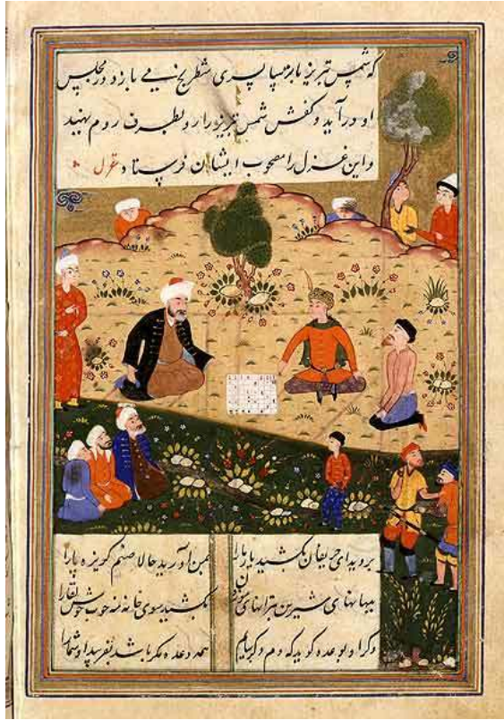
A page of a copy circa 1503 of the “Dīvān-e Šams-e Tabrīzī”