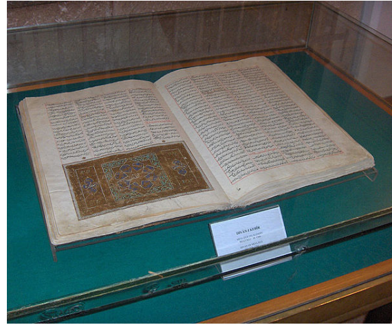
Dīvān-e Kabīr (Divan-ı Kebir) from 1366 Mevlāna mausoleum, Konya, Turkey