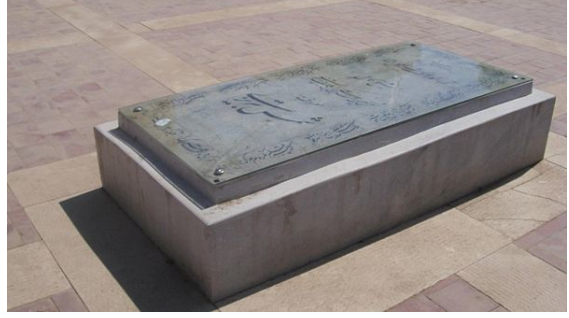
ضريح شمس الدين التبريزي في خوي.

الشمس التبريزي (582 - 645 هـ) هو عارف ومتصوف وشاعر، نسبتته إلى تبريز. هو شمس الدين، وقيل شمس الحق والدين محمد بن ملك داد التبريزي، المشهور بالشمس التبريزي، وقيل في اسمه: محمد بن علي بن ملك داد. ولد سنة 582 هـ وقام برحلات إلى مدن عدة منها حلب وبغداد وقونية ودمشق. أخذ التصوف عن ركن الدين السجاسي، وتلمذ عليه الملا الرومي البلخي. قُتل في قونية على يد جماعة من المناوئين له سنة 645 هـ، وقيل سنة 644 هـ. كان احد الدراويش (رجال الدين)، وقيل ان الشمس التبريزي راوده رؤى منذ سن العاشرة تقريبا، حيث قال لايه ذلك ولكنه لم يصدقه فبعد مدة ترك منزله وبدأ بالتجوال، بحيث انه قيل عنه بانه لم يتم بمكان أكثر من ليلة واحدة لكثرة تجواله وترحاله. كان الشمس التبريزي يكسب النقود للطعام من تفسير الاحلام وقراءة الكفوف، ولكن لم يكن احد يصدق حول الرؤى التي قال انها تراوده وكانوا يعتبرونه ب "المجنون". ادعى التبريزي بانه كلم الله والملائكة في هذه الرؤى. التقى التبريزي بالشاعر العظيم الملقب ب "مولانا" وهو جلال الدين الرومي في تجواله عام 1244م، وتكونت بعد ذلك اللقاء صداقة غيرت مجرى حياة كليهما، حيث ان الرومي تحول من رجل دين عادي إلى شاعر يجيش بالعاطفة، وصوفي ملتزم، وداعية إلى الحب، ولكن رابط الصداقة الجميل الذي ربط هذان الاثنان مع بعضهما البعض بدأ بالتاكل حتى انفصلا وذلك بعد ثلاث سنوات تقريبا على نحو مأساوي. من آثاره: مثنوية «مرغوب القلوب» و«مقالات» و«ده فصل» وديوان شعر. [1]