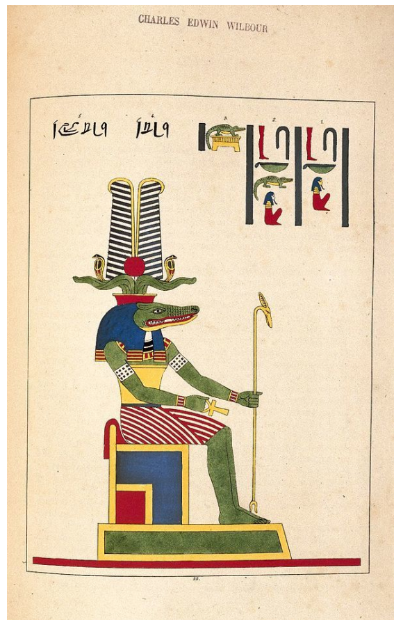
Sovk (Suchus, Cronos, Saturne), N372.2, Brooklyn Museum