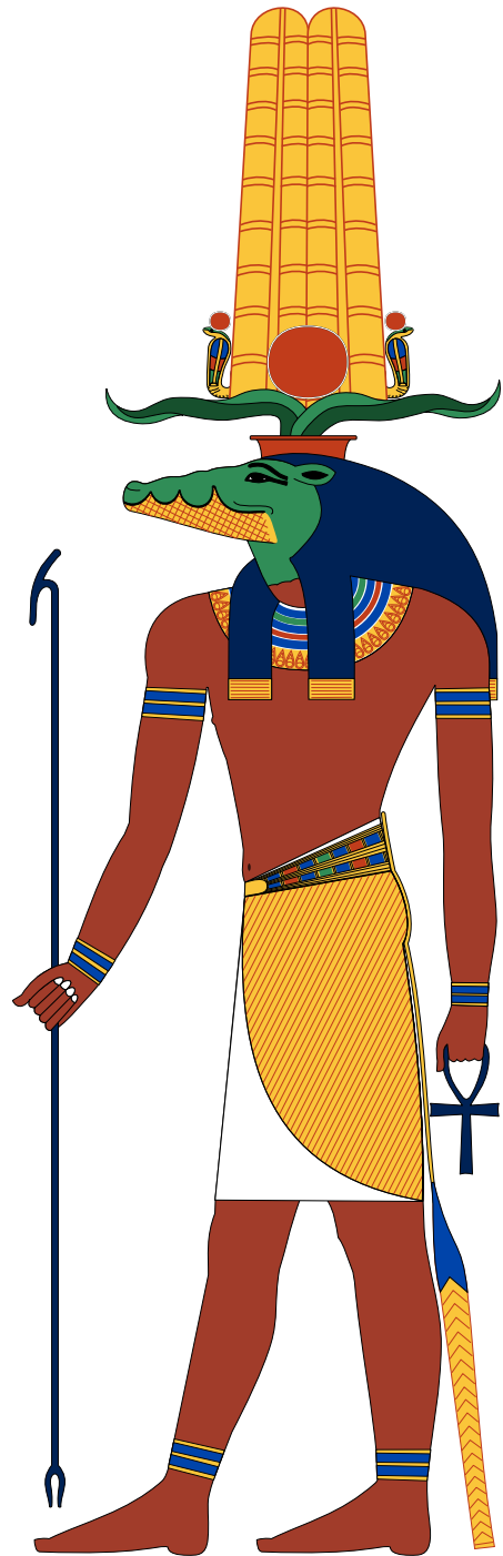
האל סובק, על ראשו כיסוי ראש המייצג את השמש. ביד ימינו ענף

דמותו של האל נקשרה גם בכוחם של מלכי מצרים, פוריות ועצמה צבאית. בנוסף שימש גם כאל מגן בעל כוחות אפוטרופאים שיכול היה בעזרת כישוף להרחיק את הרוע, במיוחד כנגד הסכנות שנבעו מהתנינים בנילוס. [1] אביו של סובק היה האל סת, ואמו הייתה האלה