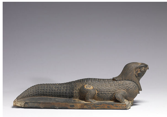
This Late Period (c. 400 – 250 BCE) statue shows Sobek bearing the falcon head of Re-Harakhti, illustrating the fusion of Sobek and Re into Sobek-Re. Walters Art Museum, Baltimore.

Though Sobek was worshipped in the Old Kingdom, he truly gained prominence in the Middle Kingdom (c. 2055—1650 BCE), most notably under the Twelfth Dynasty king, Amenemhat III. Amenemhat III had taken a particular interest in the Faiyum region of Egypt, a region heavily associated with Sobek. Amenemhat and many of his dynastic contemporaries engaged in building projects to promote Sobek – projects that were often executed in the Faiyum. In this period, Sobek also underwent an important change: he was often fused with the falcon-headed god of divine kingship, Horus. This brought Sobek even closer with the kings of Egypt, thereby giving him a place of greater prominence in the Egyptian pantheon. [7] The fusion added a finer level of complexity to the god's nature, as he was adopted into the divine triad of Horus and his two parents: Osiris and Isis. [8]