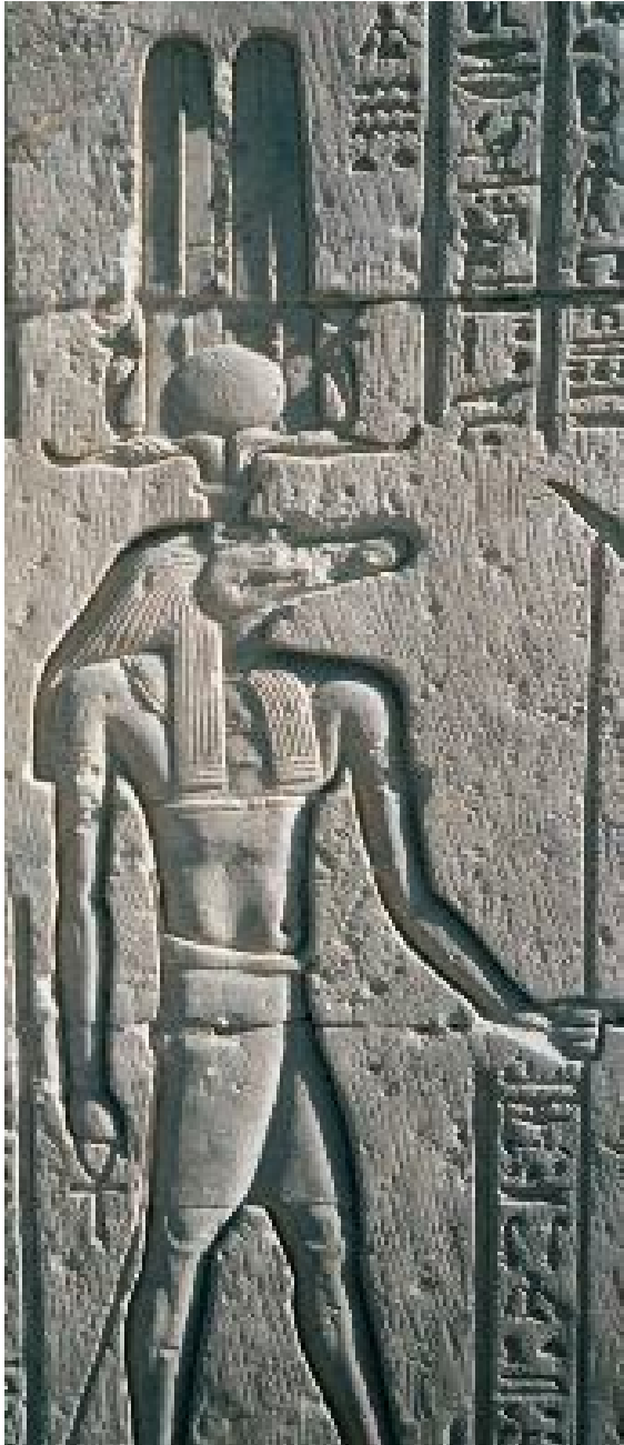
דמותו של סובק על הקיר של מקדש קום אומבו, בידו הימנית שרביט מלכות ובשמאלו ענף המייצג את תפקידו כמרפא של אוזיריס, מעל ראשו כתר שמש המייצג את השילוב של סובק-רע