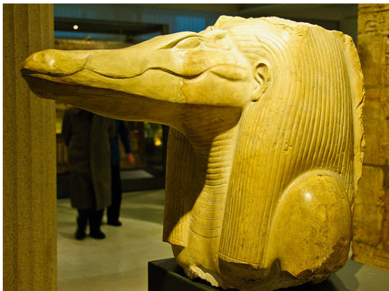
This statue of Sobek was found at Amenemhat III's mortuary temple (which was connected to his pyramid at Hawara in the Faiyum), serving as a testament to this king's devotion to Sobek. Ashmolean Museum, Oxford.

Sobek enjoyed a longstanding presence in the ancient Egyptian pantheon, from the Old Kingdom (c. 2686—2181 BCE) through the Roman period (c. 30 BCE—350 CE). He is first known from several different Pyramid Texts of the Old Kingdom, particularly from spell PT 317. [3] The spell, which praises the pharaoh as living incarnation of the crocodile god, reads: