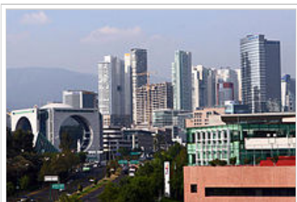
Η πόλη όπου γεννήθηκε η Thalía, το Μεξικό Σίτι, η πρωτεύουσα του Μεξικού.

οποίο εντάσσεται στις διαταραχές του φάσματος του αυτισμού και το οποίο παρουσιάζει συμπτώματα έλλειψης κοινωνικής αλληλεπίδρασης κατά την παιδική ηλικία εξαιτίας συνήθως κάποιου έντονου βιώματος. [24][25][26]