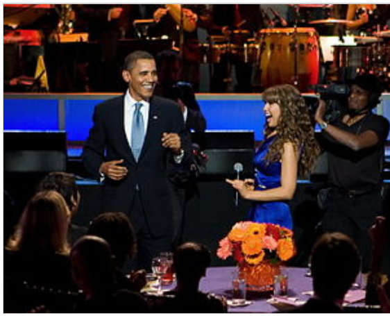
Η Ταλία καλεί τον Αμερικανό πρόεδρο Μπαράκ Ομπάμα να χορέψουν, σε ένα φεστιβάλ για την ισπανόφωνη μουσική κληρονομιά, που διεξήχθη στον Λευκό Οίκο το 2009.

κυρίως της latin pop μουσικής σκηνής, ενώ καλλιτέχνες όπως Julio Iglesias, Tony Bennett, Gloria Estefan, Ricky Martin, Britney Spears, Celine Dion, Tiziano Ferro, Michael Buble, Robbie Williams, Shakira, Lindsay Lohan, Yuri, Prince Royce και Juan Luis Guerra έχουν εκφράσει τον θαυμασμό τους απέναντι στο ταλέντο και το χάρισμά της. Επιπλέον, έχει λάβει διθυραμβικά εγκώμια για τη δουλειά της από μεγάλες τηλεοπτικές προσωπικότητες της Αμερικής όπως η Oprah Winfrey και η Rosie O'Donnell, καθώς και από τον πρόεδρο των ΗΠΑ, Barack Obama. [124][125]