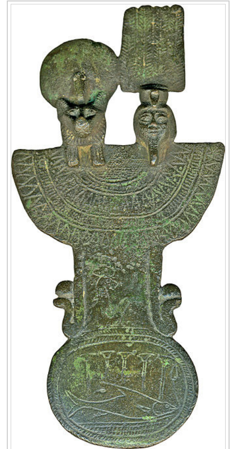
A menat (a musical instrument similar to the sistrum) depicting the goddess Tefnut and her husband-brother Shu.

At Karnak, Tefnut formed part of the Great Ennead and was invoked in prayers for the health and wellbeing of