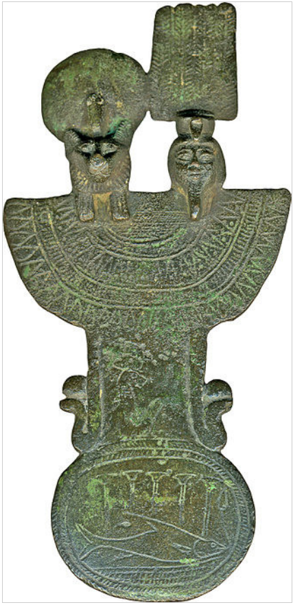
جزء برونزي من عقد زينة وعليه تفنوت وشو . (متحف والتر للفنون) - بالتيمور، ماريلاند.