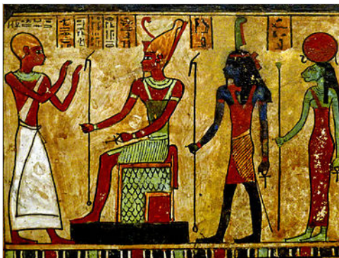
شو وتفنوت (وهي إلى اليمين) يقفان خلف أوزوريس يوم الحساب في السماء. (من متحف اللوفر).