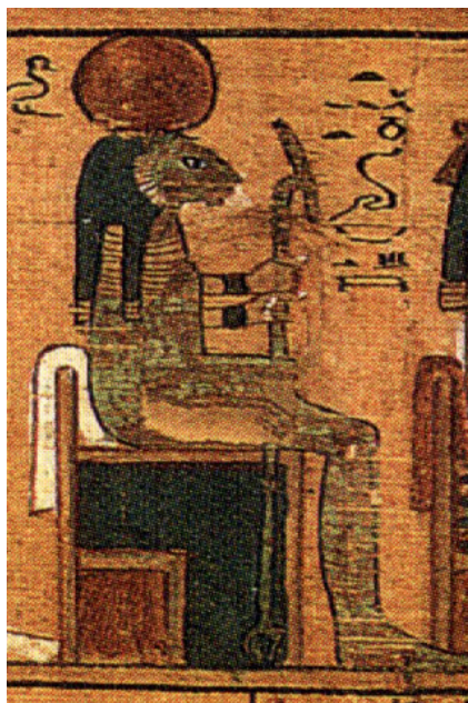
تفنوت وعلى رأسها الشمس رمز رع