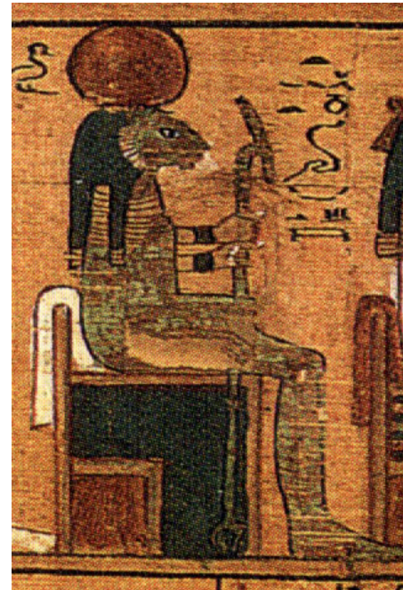
The goddess Tefnut with the head of a lioness sitting on her throne.