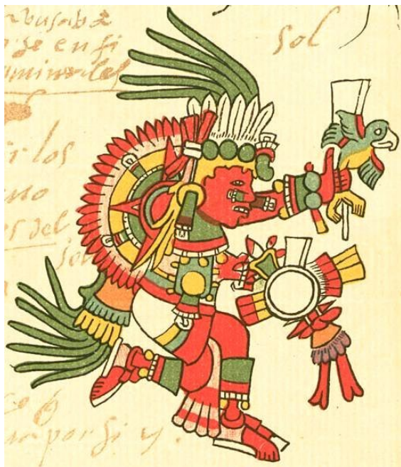
Tonatiuh as depicted in the Codex Telleriano-Remensis.

In Aztec mythology, Tonatiuh (Nahuatl: Ōllin Tō-