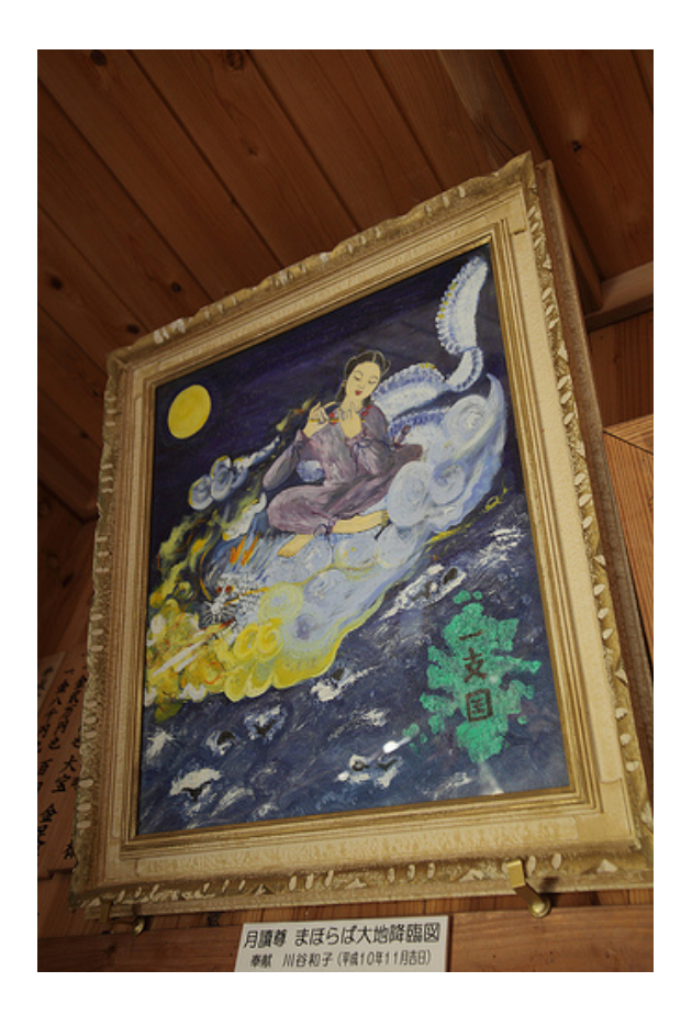
A painting completed in 1998, depicting the descent to earth of the Shintō moon god Tsukuyomi.