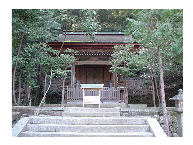
A shrine to Tsukuyomi-no-Mikoto in Kyoto

Tsukuyomi or Tsukiyomi (月 読, also known as