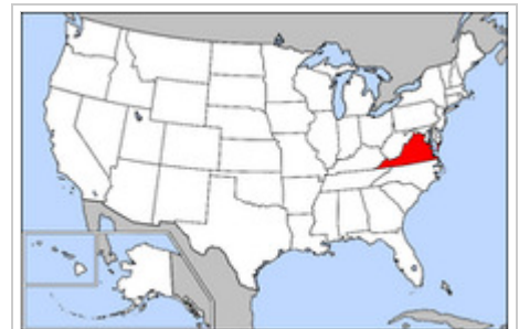
Map of US highlighting Virginia