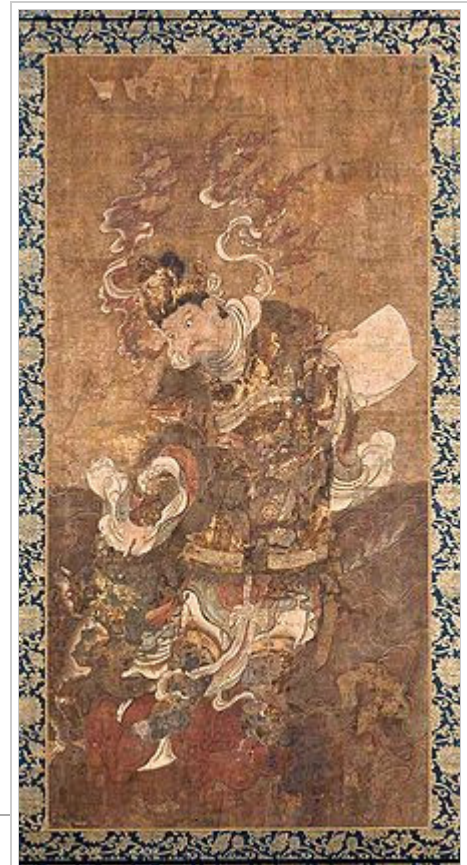
Painting of Kōmokuten (Virūpākṣa), the Guardian of the West (Sinhala: විරූපාක්ඡ) (one of the Four Guardian Kings). 13th century.