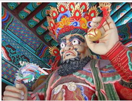
Korean statue of Gwangmok Cheonwang (Virūpākṣa)

Virūpākṣa (Japanese: 広目天 Kōmoku-ten ) is one of the Four Heavenly Kings representing the cardinal direction of the west in Buddhist cosmology.