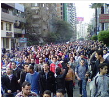
مجموعه من المتظاهرين يوم يناير.