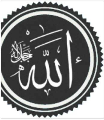
كلمة الله، اسم الاله عند المسلمين

اغلب المسلمين ينتمو للمذاهب الكبار و هم المذهب السنى بطوائفه و مذاهبه الفقيهه و المذهب الشيعى بطوائفه . الإسلام بيعتبر أسرع دين انتشر فى العالم و امتد فى فتره قياسيه من الصين شرقاً لجنوب غرب أوروبا غرباً ، و منه خرجت حضاره جديده فى العالم هى الحضاره الاسلاميه. النهارده الاسلام هو الدين السايده فى الشرق الأوسط ، و شمال افريقيا ، و مناطق كتيره فى اسيا و جنوب الصحرا الكبرى فى افريقيا. معظم المسلمين مش عرب اللى بيعتبروا 20% من عدد المسلمين فى العالم ، و أكثر دوله فيها مسلمين هى اندونيسيا و أعداد مش صغيره موجوده فى الصين و روسيا و مناطق البلقان والكاريبى. حوالى 13% من المسلمين عايشين فى اندونيسيا اللى بتعتبر أكبر دوله إسلاميه. 31% من المسلمين بيعيشوا فى شبه القاره الهنديه . عدد المسلمين حالياً حوالى 1.97 مليار. ده بالإضافة للى بيعتنقوا الإسلام والمهاجرين المسلمين الموجودين تقريباً فى كل نواحي العالم. الإسلام هو أسرع دين انتشار فى العالم ..... (اعرف اكثر عن الاسلام...)